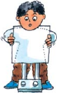
照 X 光