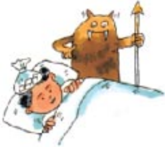
病童抵抗力弱， 易受細菌感染