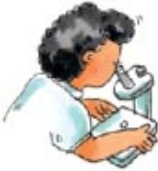
看顯微鏡， 檢查骨髓中的血癌細胞